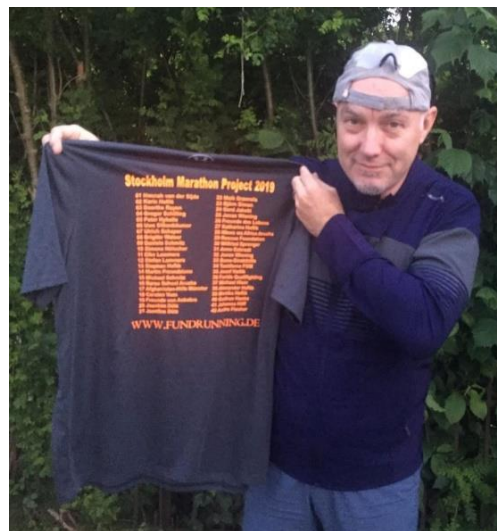
KM Paten für Iron Alex