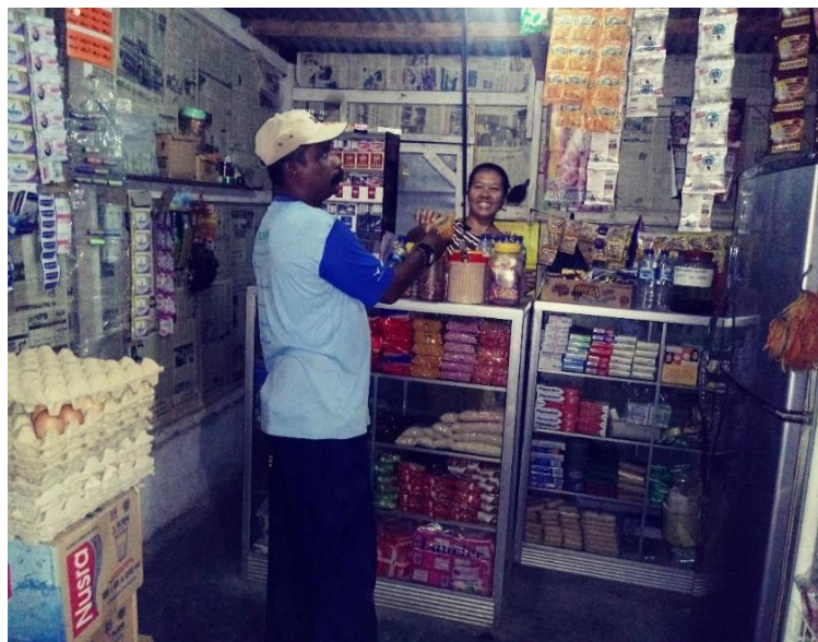
Kleinstdarlehen zur Existenzgründung / Aufbau und Betrieb eines Kiosk