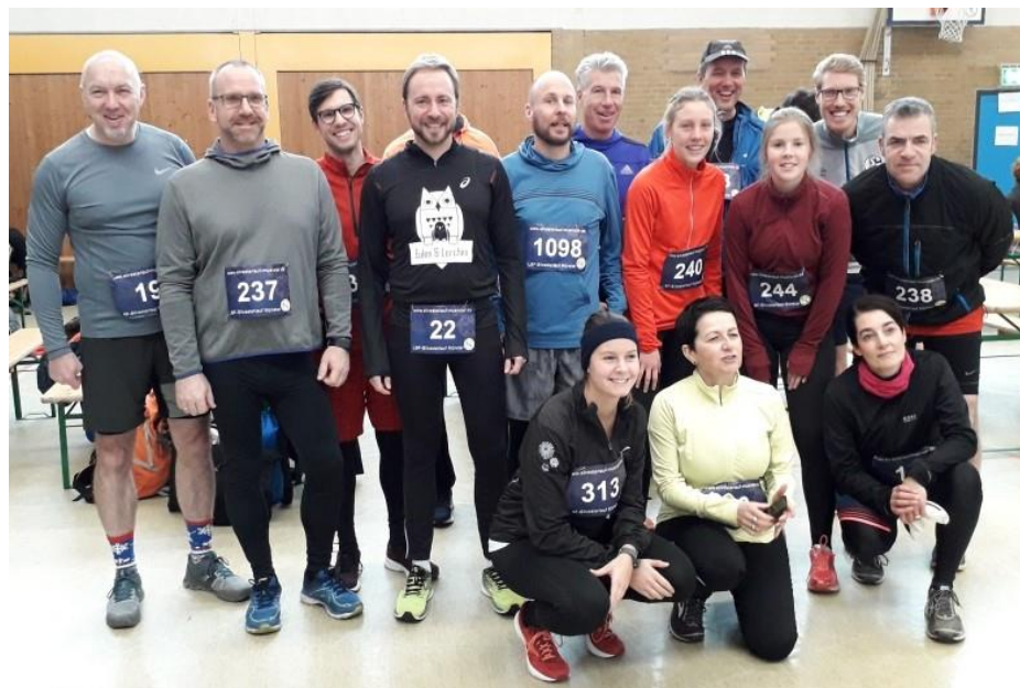
Silvesterlauf Münster 31.12.2019

Refine Your Sport! Veredle Deinen Sport! Mit Team Ronouchi und Fundrunning for a better world