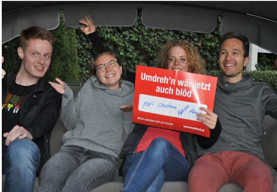
Münster Staffelmaraathon 2019: Team Ronouchi MBILI

Der eine wartet, dass die Zeit sich wandelt, der andere packt sie kräftig an und handelt. Dante Alighieri