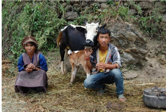
Nutztiere für alleinerziehende Mütter