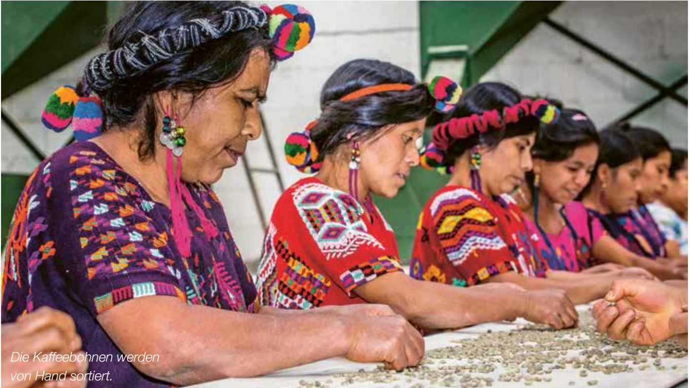
Die Kaffeebohnen werden von Hand sortiert.