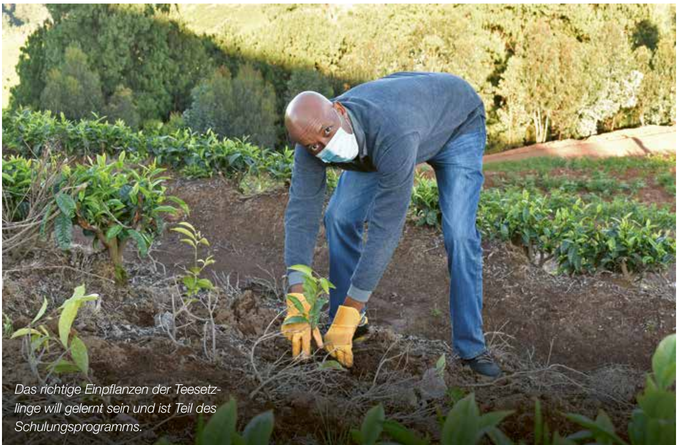
Das richtige Einpflanzen der Teesetzlinge will gelernt sein und ist Teil des Schulungsprogramms.

Während die Teefabriken die Produktion der Setzlinge verantworten, werden die Kosten dafür von der internationalen Oikocredit Stiftung getragen. Sie finanziert zudem Schulungen, in denen Kleinbäuer*innen Kompetenzen im Teeanbau erwerben. Die Mittel für das zweijährige Projekt, rund 140.000 Euro, stammen größtenteils von Anleger*innen des Westdeutschen Förderkreises, die sich