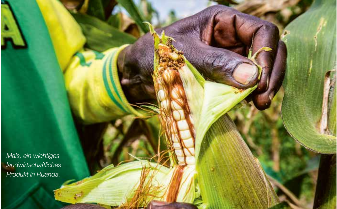
Mais, ein wichtiges landwirtschaftliches Produkt in Ruanda.