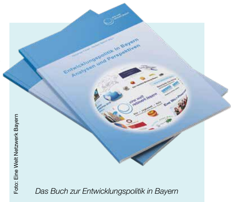
Das Buch zur Entwicklungspolitik in Bayern